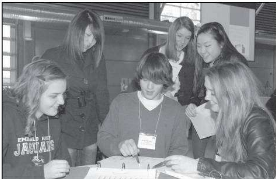
Los estudiantes de high school de todo el distrito discuten las declaraciones de misión y visión, durante una reciente reunión del equipo Visión 2020.

La misión en general del distrito –su propósito como una comunidad educativa– guía diariamente a los empleados, mientras que trabajan con más de 21,500 estudiantes. Puyallup es el noveno distrito escolar más grande en el estado.